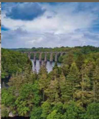
Viaduc de la vallée du Gouët