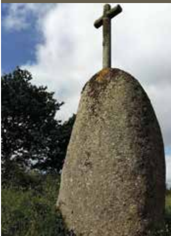
Croix de Pasquiou

Des champs, des bosquets, une chapelle, des prés puis d'étonnantes grandes et longues pierres... Ces gros blocs de granit parsèment le paysage de la commune du Vieux-Bourg, semblant pousser dans ses champs. Tantôt dressés, tantôt couchés, ils y sont ancrés depuis des millions d'années. Ces mégalithes invitent à un voyage dans la préhistoire et à se questionner sur les pratiques des Hommes de ce temps. Bienvenue au cœur de la campagne costarmoricaine !