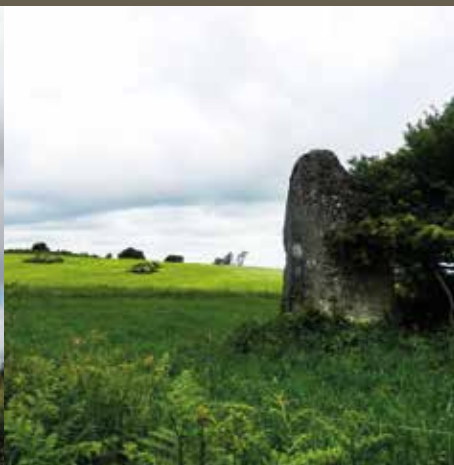
Menhir de Crec'h Ogel