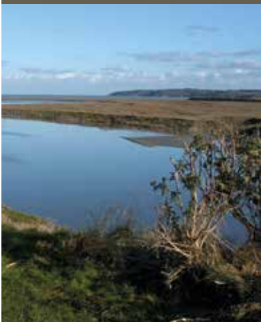
Grèves de Languoux

Calme, secrète, sauvage, l'anse d'Yffiniac, partie la plus avancée dans les terres de la Baie de Saint-Brieuc, se découvre au fil du chemin des grèves. Cette réserve naturelle nationale, au paysage de filières d'eau encerclant des prés salés, totalement recouverts lors des grandes marées, accueille des oiseaux d'ici et d'ailleurs. L'Homme a su aussi y trouver de nombreuses ressources. En surplomb, la ville de Languoux cache en son centre un « Grand Pré » où les cachettes et chemins de traverse y sont nombreux et la biodiversité très riche.