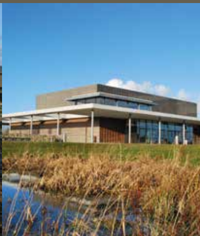
Le Grand Pré