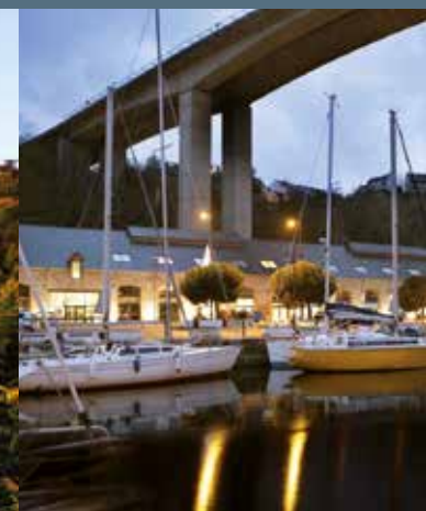
Le Carré Rosengart, Quai Armez