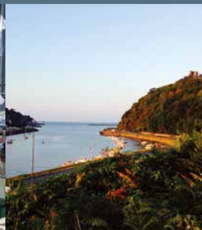
La Tour de Cesson veille sur le port Embouchure du port du Légué