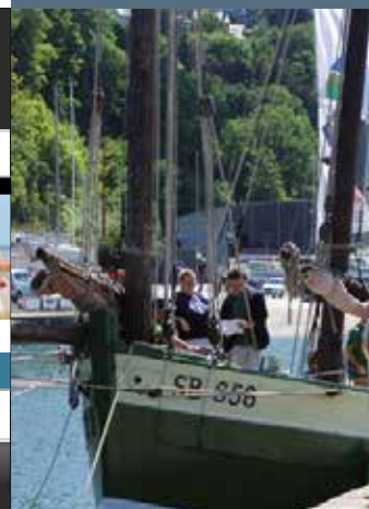
Le Grand Léjon, Voilier traditionnel