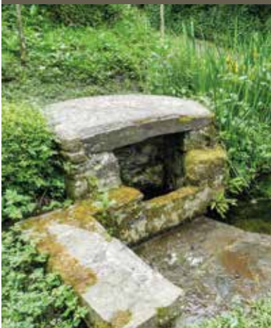
Fontaine du Roselier

Avec une vision à 360° sur la Baie de Saint-Brieuc, la pointe du Roselier est un point de vue incontournable. Ainsi l'ensemble de la baie, jusqu'au fond de l'anse d'Yffiniac classée Réserve Naturelle Nationale, se dévoile sous nos yeux. Cette vue imprenable a fait de la pointe un site stratégique dès l'âge du fer. On pouvait y surveiller l'horizon afin de se défendre ou communiquer avec les navigateurs. En contrebas, la plage de Martin, crique de rochers, galets et sable, est l'un des paradis du coin pour les pêcheurs à pied.