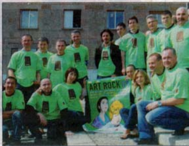
Le Télégramme. 15 mai 2009