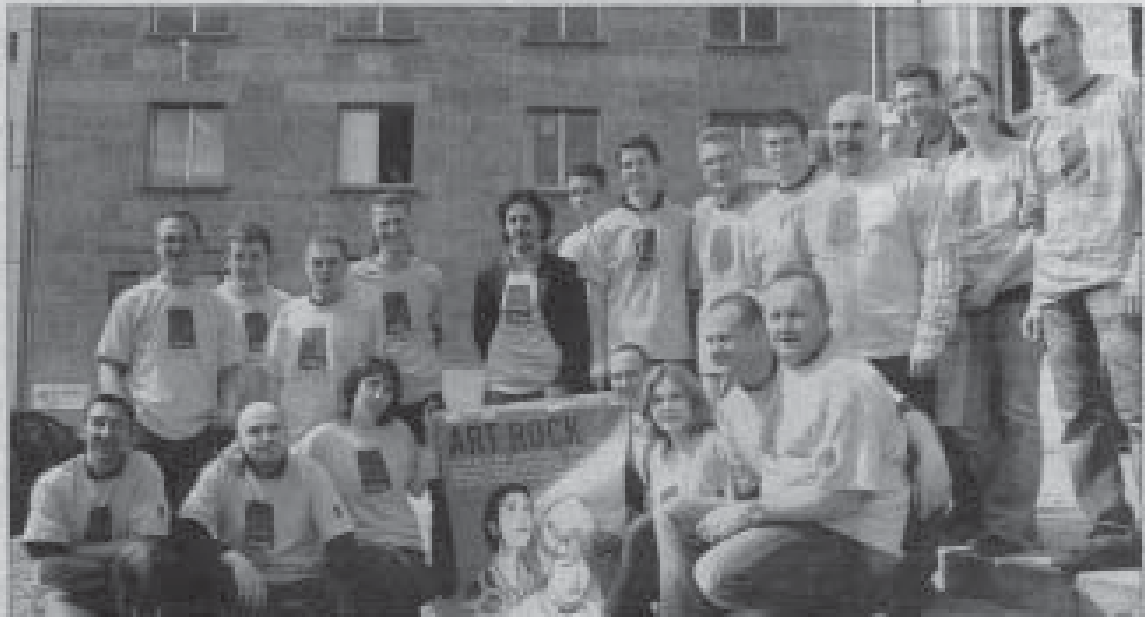
Le collectif Rock'n Toques s'est réuni hier après-midi, à La Passerelle, pour occuper les places qui seront proposées lors du festival Art Rock.

Ils avaient ravi les papilles des festivaliers pour la première fois, l'an passé, lors du festival Art Rock. Dans deux semaines, restaurateurs et cavistes leur donneront un nouveau rendez-vous, place de la Résistance.