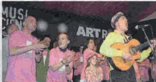
Les chefs de Rock'n toques ont partagé la scène avec les artistes du métro, l'an dernier, le dernier jour du festival.

L'hommage à Fulgence Bienvenüe, originaire d'Uzès et père du métro de Paris, est aussi réitéré. Le principe : inviter des artistes choisis par la RATP pour égayer les trajets des 4,8 millions de voyageurs. Guadeloupe (Argentine), Chengetal (Zimbabwe), Adjabel (Liban), les Balafons de l'Afrique de l'Est (Burkina-Faso)... sont notamment programmés. Une place sera faite aussi aux artistes locaux De Poi