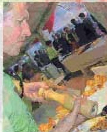
Chaud devant ! Le collectif Rock'n Toques monte sur scène.

17 h et 19 h, au cœur du village Art Rock, place de la Résistance. 6 € l'assiette, 2,50 € le verre de vin.