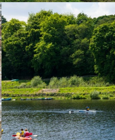
Le Circuit du Barrage