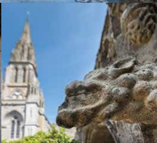
Basilique N.D. de Délivrance et Fontaine N. D. d'Entre les Portes Rue Notre Dame