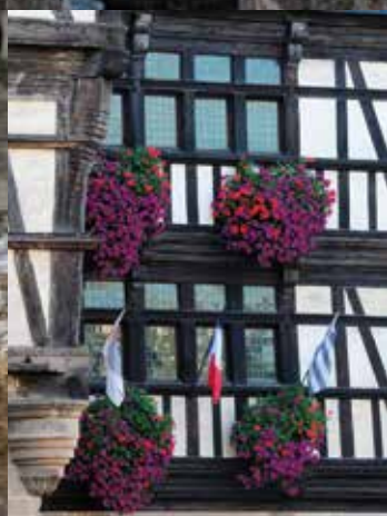
Maisons à pans de bois Place 1830