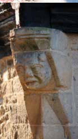
Le «Papa au Lait» ou «Bonhomme Quintin» Place 1830