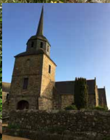
Église de Tréveneuc