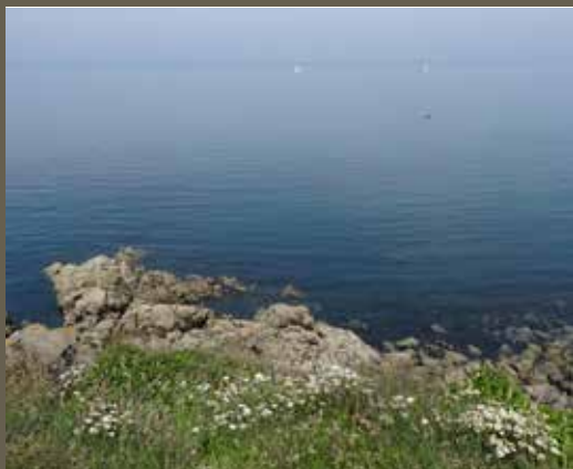
Bec de Vir

Remonter vers le centre-bourg par le circuit adapté indiqué. Environ 1,1 km de montée par la vallée aménagée du Kerpont au bord de la rivière Kercadoret.