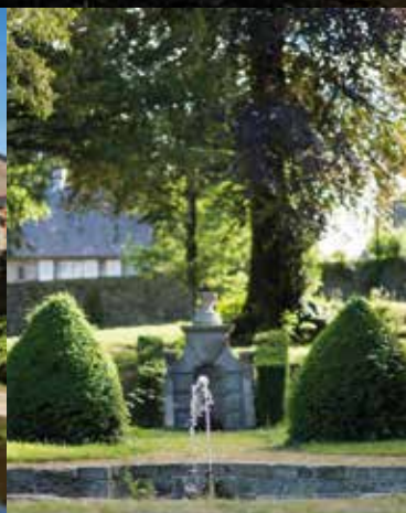
Parc Roz Maria, 6 rue des Carmes