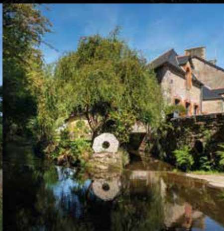
Maison sur le Gouët, rue de la Madeleine