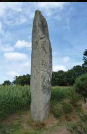
Menhir de la Roche Longue, 18 rue de la Fosse Malard