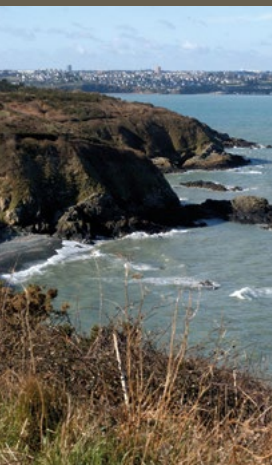
La pointe des Guettes

Rundweg um die Halbinsel Hillion an der Küste: Schnappen Sie frische Luft inmitten des größten nationalen Naturschutzgebiets der Bretagne! 8,9km Rundweg voller Entdeckungen in einer geschützten Küstenlandschaft, in der eine einzigartige Flora & Fauna gedeiht. Ausgestattet mit festen Schuhen und einem Fernglas sind Sie hier im ersten Rang für ein außergewöhnliches Naturschauspiel! Ein Besuch in der Maison de la Baie wird Ihren Besuch abrunden und ihre Erfahrung erweitern.