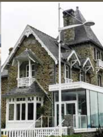
Centre Nautique de Saint-Brieuc