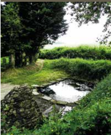
Fontaine de Saint-Eloy

Au creux d'un chemin, une fontaine. Au détour d'une rue, une chapelle. La campagne bretonne recèle de trésors anciens, témoignant souvent d'une tradition religieuse bien ancrée. En toile de fond, la Baie de Saint-Brieuc, qui dévoile une longue étendue de sable à l'approche du littoral. Cet endroit en a séduit plus d'un et notamment l'inventeur du baby-foot, Lucien Rosengart, qui y vit un potentiel certain pour créer une station balnéaire. Ainsi se développa la plage des Rosaires, bien connue et très fréquentée de nos jours.